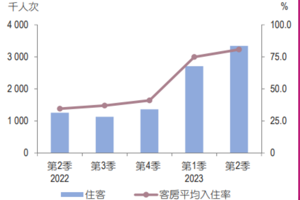
客房平均入住率及住客數目